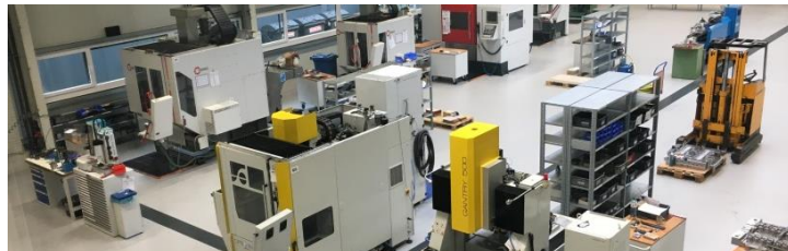
BERUF MIT ZUKUNFT