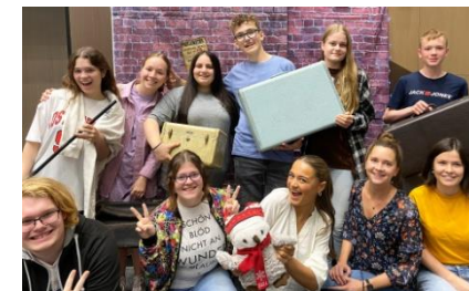
Die diesjährigen Projektteilnehmer:innen der JKG in den USA

Dieser GAVE & GAPP genannte Austausch dient der Entwicklung einer interkulturellen Kompetenz, dem Abbau von Sprachbarrieren und erweitert die individuellen Horizonte.